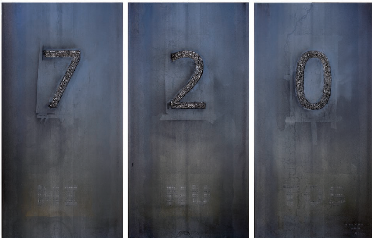
720 minutos. Hierro, soldadura de acero inoxidable y óleo. 3 piezas de 200 x 100 x 1 cm c/u. Obra de tiempo exacto. De 8:55 a 20:55, 20 – 11 – 08

Balanza es un artista conceptual con una gran versatilidad a la hora de trabajar materiales, tanto en sus trabajos sobre lienzo como en sus intervenciones sobre metal que trabaja con óleo, grafito y soldadura, quedándose a medio camino entre la representación pictórica y la intervención industrial, y fijando las manchas del humo, las chispas de soldadura o las virutas que saltan del trabajo como parte misma de la pieza. Creando, en definitiva, obras con una potencia expresiva y emocional que portan, en cada mirada, parte del tiempo vital del artista.