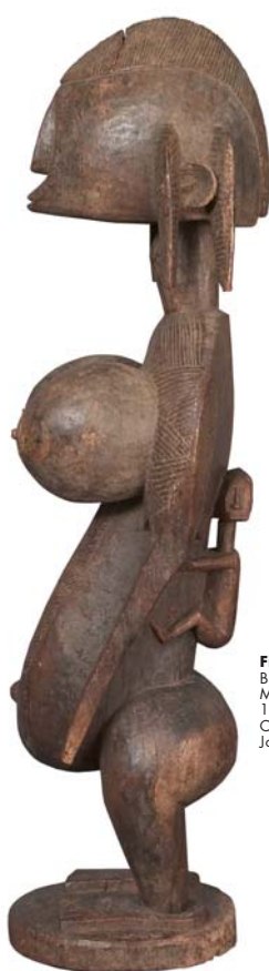
Figura femenina/Feminine figure Bambara, Mali Madera/Wood 113 x 27 x 29 cm. Colección José de Guimarães José de Guimarães Collection

Black Gioconda/Gioconda negra 1975 Acrílico sobre lienzo Acrylic on canvas 99.5 x 80.5 cm. Colección Würth/ Würth Collection Inv. 6464