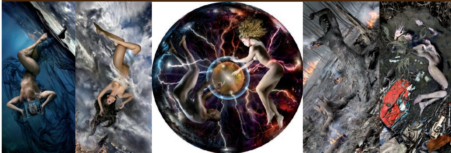
5 Elementos (Água, Ar, Polaridade, Fogo e Terra) / 5 Elementos (Agua, Aire, Polaridad, Fuego y Tierra) / 5 Elements (Water, Air, Polarity, Fire and Earth), 2007 Impresión digital sobre poliestireno expandido / Digital print on expanded polystyrene, 200 x 600 cm COLECCIÓN BERARDO / BERARDO COLLECTION

DDiArte reflect in their works their passion for the body, and taking the artistic nude and big format works as their favourite recourse, they transmit their messages to us, loaded with strong criticism of contemporary society. Nothing is left to chance in their work. Every scene is represented as a play of second intentions and multiple meanings, hidden at first sight. This pair invites us to take a trip into a secret universe, looking beyond appearances. We find photographs within each photograph. Huge canvases full of details and symbolism. One example of this is the work 5 Elementos , which seeks to draw attention, materialised in small details, towards an increasingly more worrying reality. After a reading of the work in sections, it is presented to the spectator as a single whole.