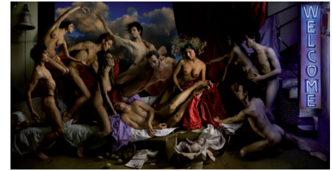
Welcome / Bienvenida, 2009 Impresión digital sobre lienzo, en caja de luz Digital print on canvas, on a lightbox, 105 x 200 cm COLECCIÓN WÜRTH ESPAÑA / WÜRTH SPAIN COLLECTION

Las obras aquí presentadas son el reflejo de una perfecta simbiosis entre la herencia clásica y la experimentación con las nuevas tecnologías. Con una mentalidad eminentemente renacentista, mitos y leyendas vuelven a ser fuente de inspiración. Reinterpretando a artistas de la talla de Tiziano o Caravaggio; personajes mitológicos e iconos religiosos ( Welcome , Redemption ) son reinventados y desvinculados de su sentido arcaico para dar cabida a una nueva realidad, la visión del mundo de estos artistas-fotógrafos. Las luces y las sombras que definen los cuerpos centran la atención en la distribución, invitando al espectador a mirar y transportar la mente a ambientes oníricos. Corpvs nos ofrece una nueva visión del cuerpo humano a través de los ojos de estos artistas madeirenses, que promete sorprender y no dejar a nadie indiferente.