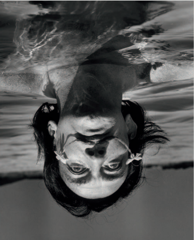
SAVADOR DALÍ Sin fecha / Undated Fotógrafo / Photographer: Jean Dieuzaide Colección Würth / Würth Collection, Inv. 7055

ART FACES RETRATOS DE ARTISTS ARTISTAS PORTRAITS EN LA IN THE COLECCIÓN WÜRTH WÜRTH COLLECTION 20/03/15-28/02/16