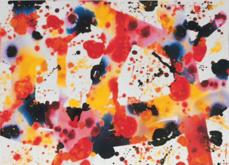
SAM FRANCIS Komposition / Composition / Composition, 1973 Gouache sobre papel / Gouache on paper 65 x 78 cm Colección Würth / Würth Collection, Inv. 3474